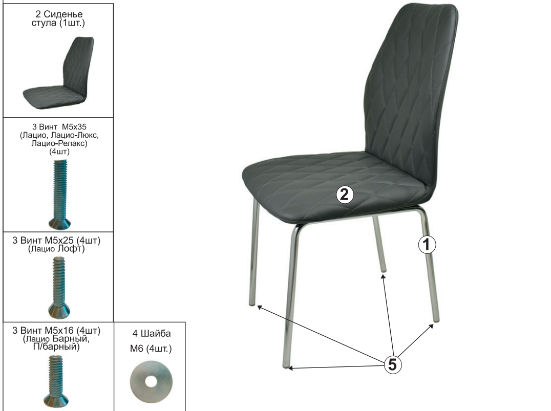
СХЕМА СБОРКИ СТУЛА «Лацио», «Лацио ЛОФТ», «Лацио ЛЮКС», «Лацио РЕЛАКС», «Лацио БАРНЫЙ», «Лацио П/БАРНЫЙ»