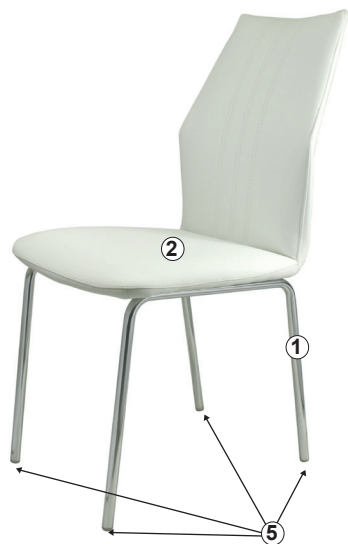
СХЕМА СБОРКИ СТУЛА «МОДЕНА», «МОДЕНА ЛОФТ», «МОДЕНА ЛЮКС»