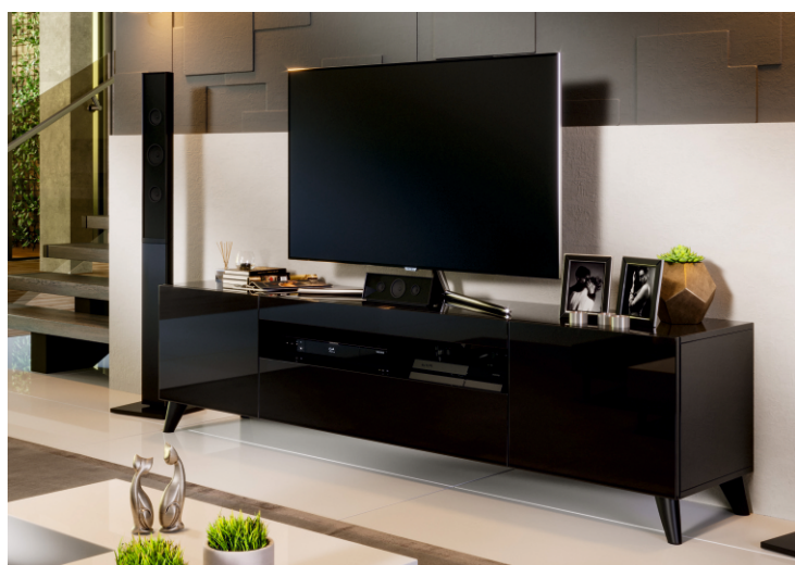
Исполнение 3 цвет «Черный» лак глянец Опоры ППУ