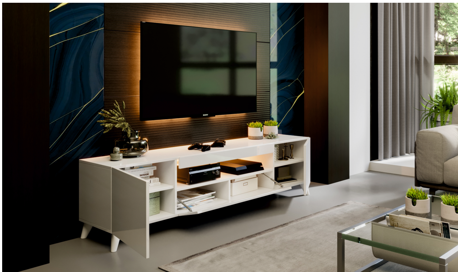
Исполнение 1 цвет «Белый» лак глянец Опоры ППУ