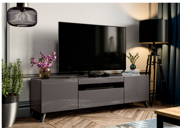
Исполнение 2 цвет «Оникс серый» лак глянец Опоры ППУ