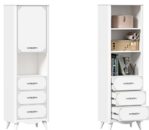
Стеллаж с ящиками