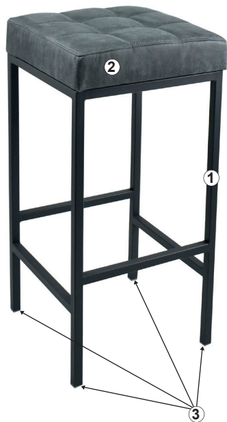
СХЕМА СБОРКИ СТУЛА «ОЛИМПИА»