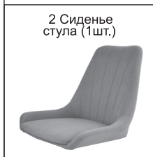
СХЕМА СБОРКИ СТУЛА «МАРИНО», «МАРИНО ЛОФТ», «МАРИНО ЛЮКС», «МАРИНО РЕЛАКС», «МАРИНО БАРНЫЙ», «МАРИНО П/БАРНЫЙ»