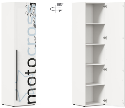
Шкаф одностворчатый Тип 1