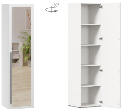
Шкаф с зеркалом одностворчатый Тип 1