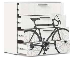
Комод Тип 2