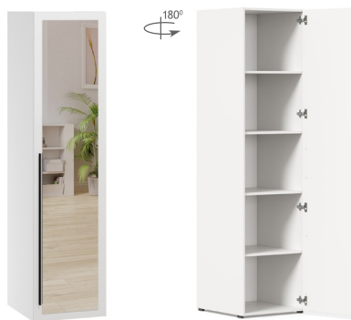
Шкаф с зеркалом одностворчатый Тип 2