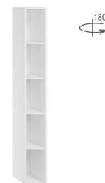
Стеллаж Тип 2