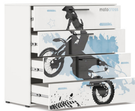
Комод Тип 1