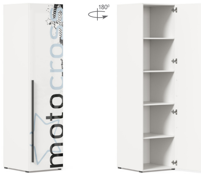
Шкаф одностворчатый Тип 2