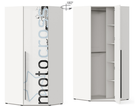
Шкаф угловой 45°